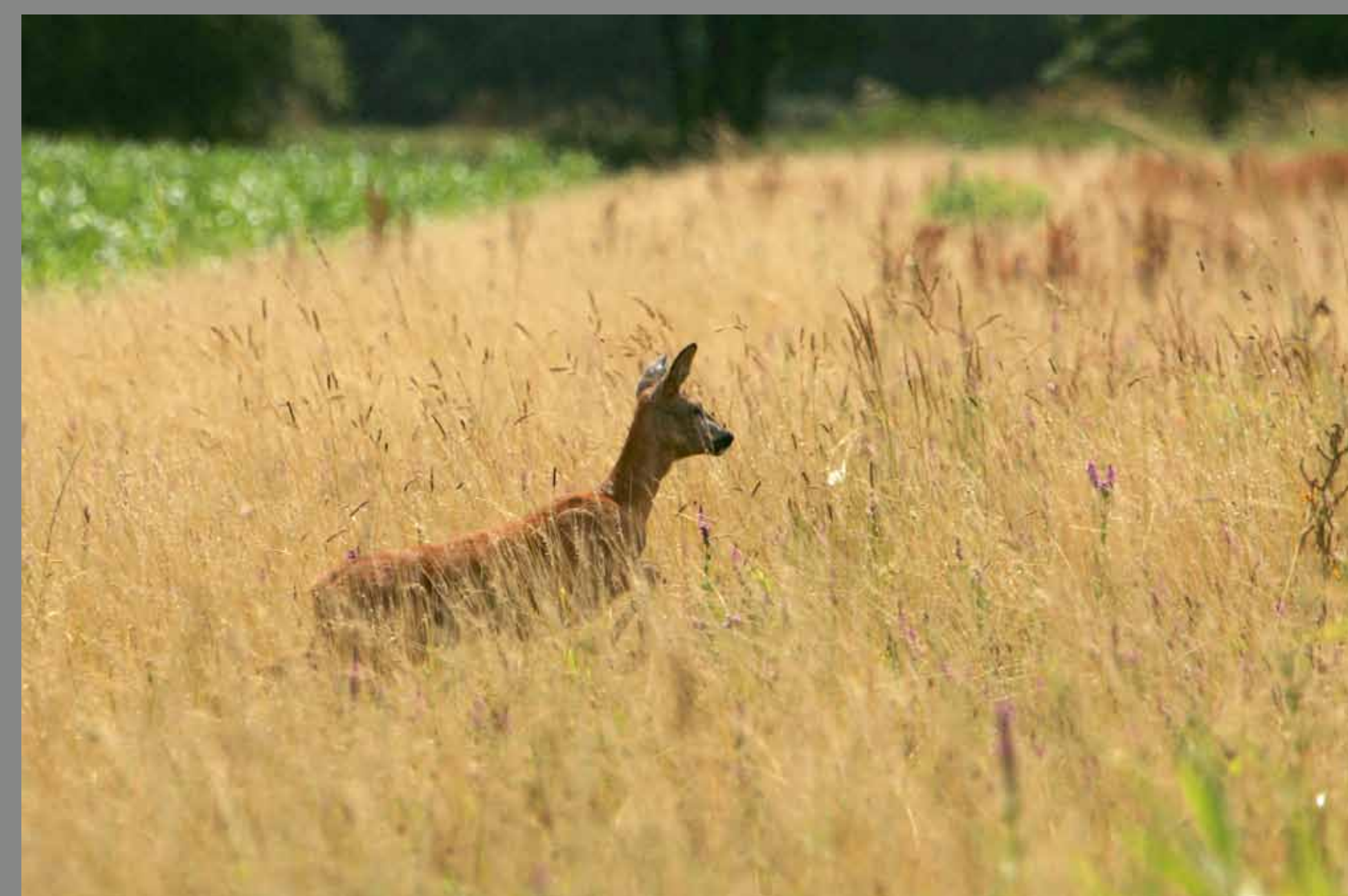
La mise en place de cultures pour la faune sauvage crée des espaces de vie précieux pour les ongulés, les petits mammifères, les oiseaux et les insectes.