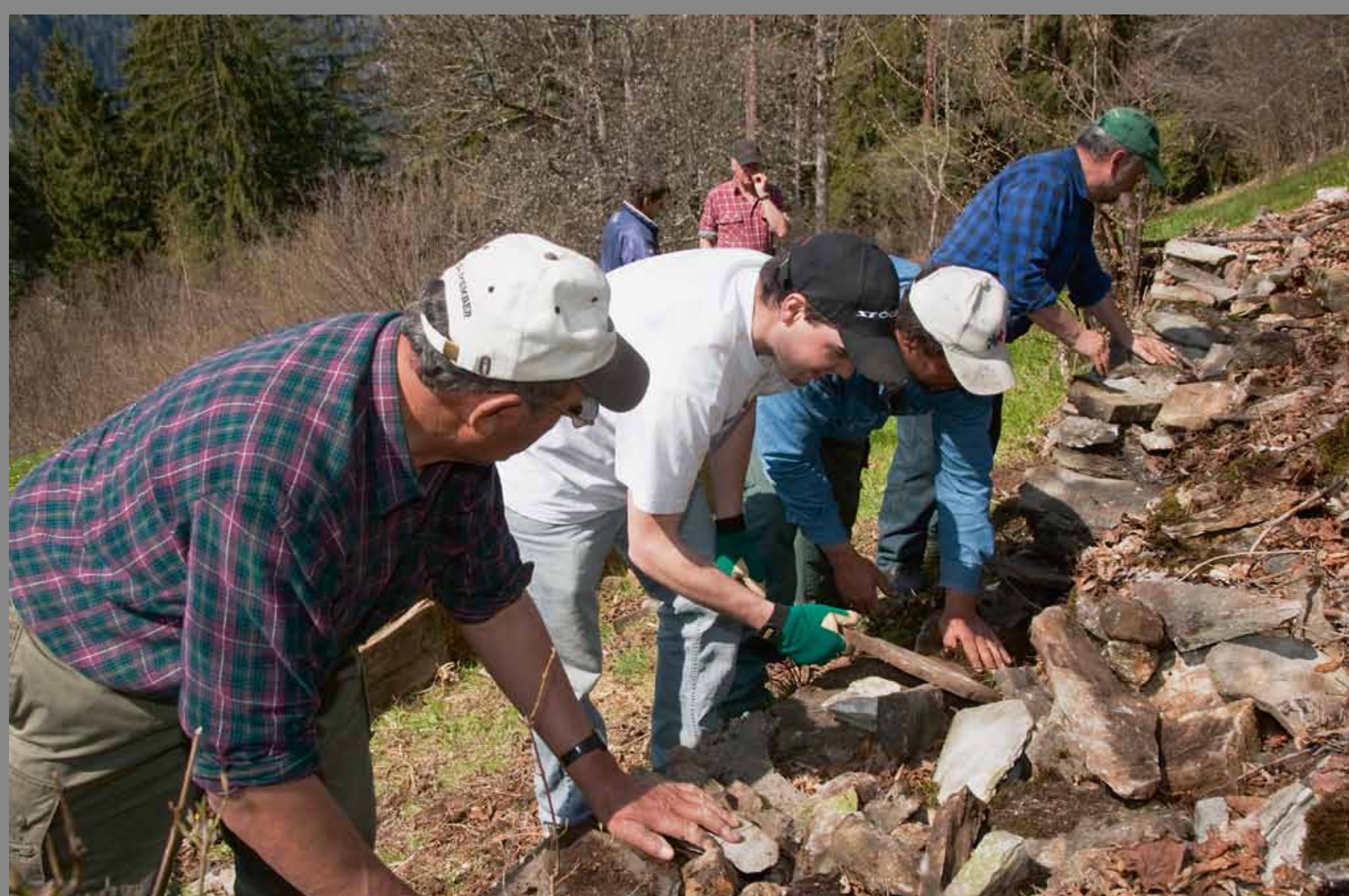
L'entretien et la remise en état de murs secs créent un espace de vie pour les petits animaux, les reptiles et les petits mammifères.