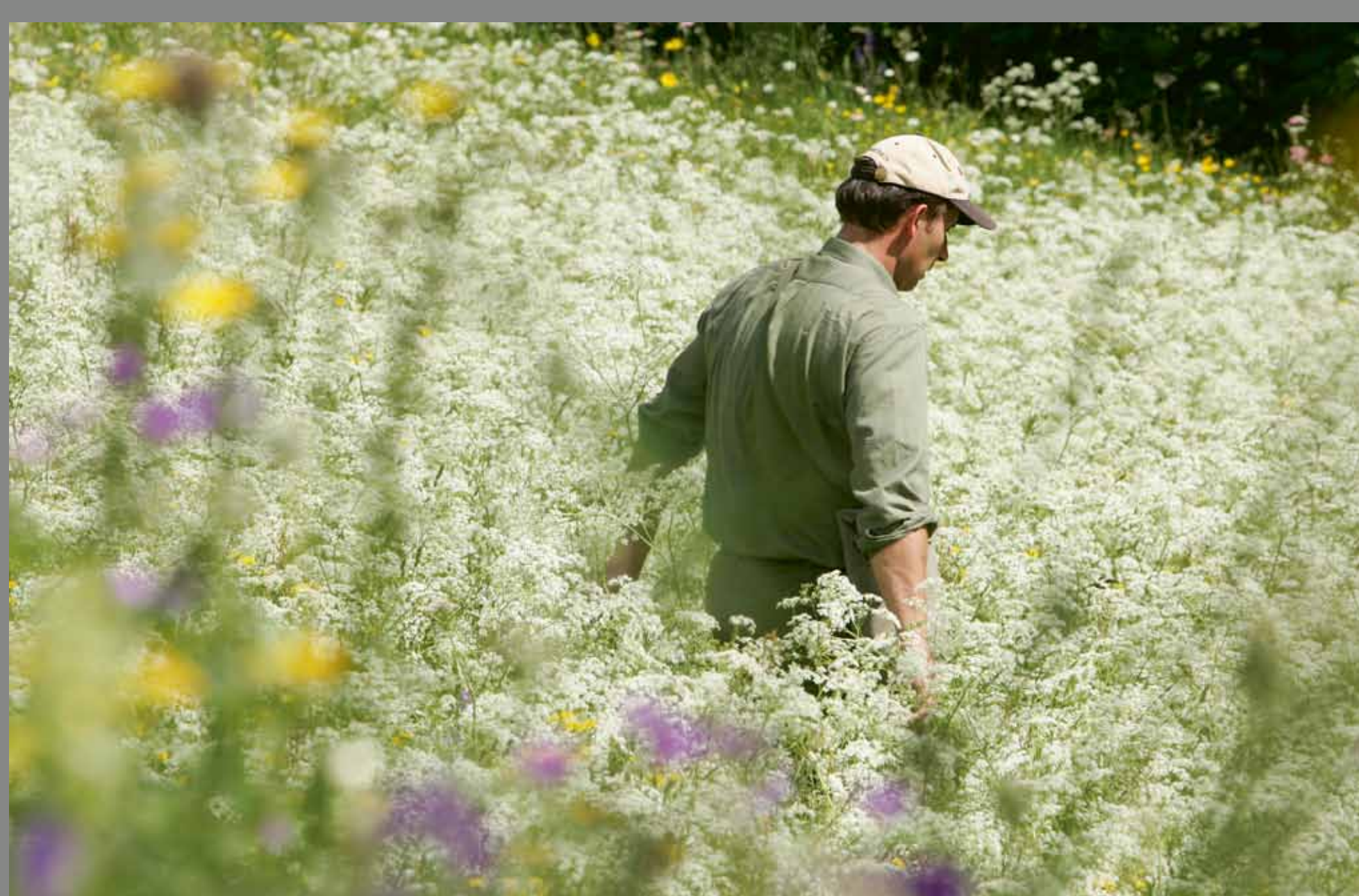
Le sauvetage des faons préserve de nombreux jeunes animaux d'une mort certaine pendant le fauchage.